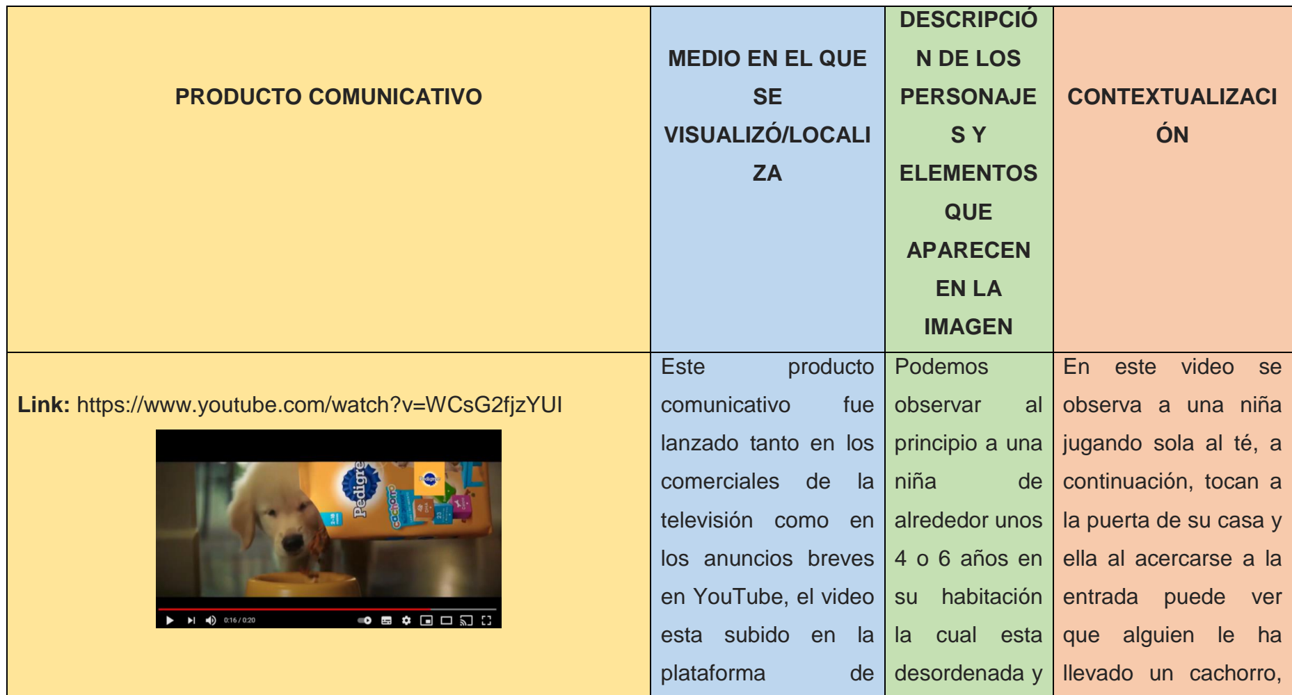
Tabla #1 Análisis denotativo de la campaña “Alimenta lo bueno”